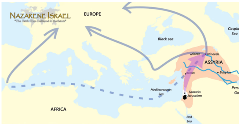
The Assyrians take the Israelites captive (734-732 BC and 724-721 BC) → Israel scatters and blurs in the world

Yahweh envió continuamente profetas para intentar que el pueblo del reino del norte se volviera y se arrepintiera, pero el pueblo no escuchó. Más bien, siguieron incumpliendo la Torá.